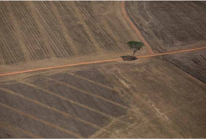
Agrarprodukte, die etwa auf Entwaldung basieren, ließen sich mit Importabgaben erschweren.