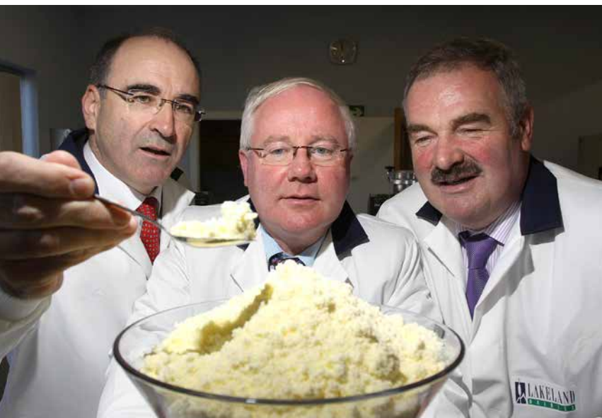
Milchpulverproduktion in Irland.