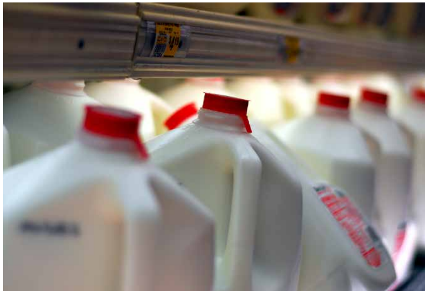
Europäische Molkereien produzieren mehr Milch, als der hiesige Markt aufnehmen kann.

Da Deutschland mehr Molkereiprodukte exportiert als importiert, haben die Preisschwankungen an den internationalen Märkten auch Auswirkungen auf den Milchpreis für die deutschen Milcherzeuger*innen. Darüber hinaus stellen Flächenknappheit, Mangel an qualifizierten Arbeitskräften sowie steigende