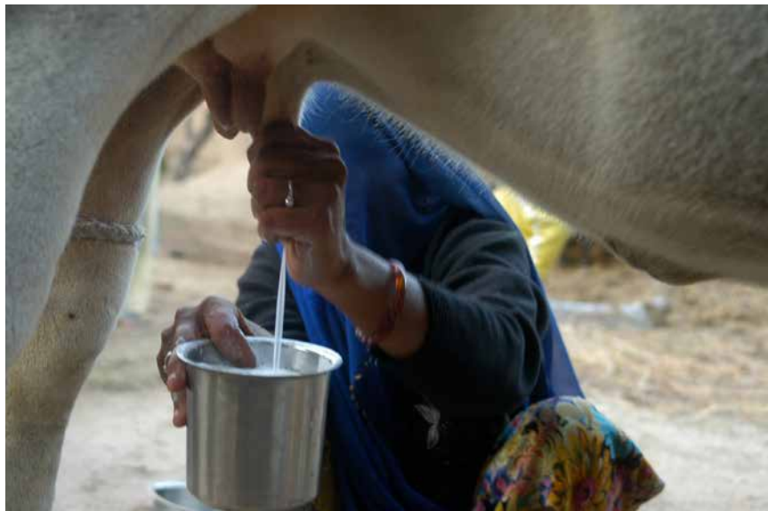
Frau in Indien melkt eine Kuh.