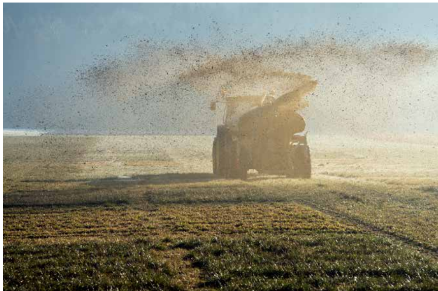
Wohin mit dem ganzen Mist?

Auch gentechnisch verändertes, mit Pestiziden wie Glyphosat behandeltes Soja und Mais wird nach Europa importiert und dort an Milchkühe verfüttert. 23 Viele der verwendeten Pestizide sind in der EU verboten. In Milch wurden bereits Gene nachgewiesen, wie sie für Gen-Mais oder Gen-Soja typisch sind. 24 Verbraucher*innen können nicht ausschließen, auch Produkte zu sich zu nehmen, die von Tieren stammen, die mit gentechnisch veränderten, pestizidbelasteten Futtermitteln gefüttert wurden, denn es gibt keine Kennzeichnungspflicht dieser Lebensmittel.