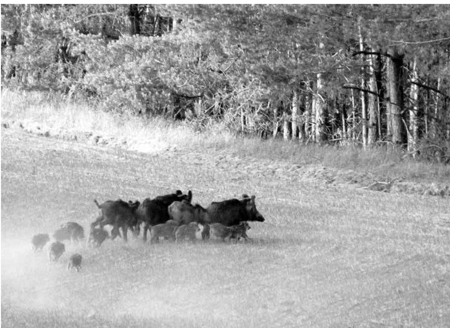
Wildschweine sind schnell und schlau.

Der internationale Schweinemarkt ist ein Haifischbecken, in dem nun das Pestgeschehen wie ein zusätzlicher unberechenbarer großer Raubfisch agiert. Wenn sich die Afrikanische Schweinepest in China – wo sie erst kürzlich überhaupt aufgetaucht ist – weiter ausbreitet, haben europäische Exporteure gute Chancen, den steigenden Einfuhrbedarf zu bedienen. Voraussetzung für das Geschäft ist, dass die Viruserkrankung nicht im eigenen Land ausbricht. Dann wäre aus hiesiger Sicht der asiatische Markt sofort zu – und zwar für längere Zeit. Die ASP-Fälle in Belgien und der daraufhin gefolgte Einfuhrstopp nach China, Japan, Südkorea und weiteren Drittländern haben die belgischen Schweinefleischexporte fast zum Erliegen gebracht. Auch große Schlachtkonzerne in Niederlanden und Deutschland haben den Import und die Verarbeitung von belgischem Schweinefleisch vorübergehend gestoppt. Hoffnung für Belgien ist, die Ware mit Preisabschlägen auf dem europäischen Binnenmarkt zu verkaufen. Die Auswirkungen für den gesamteuropäischen Schweinemarkt liegen auf der Hand. sg