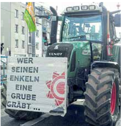
Klimawandel stoppen, Trecker auf der Demo in Köln