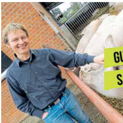
Warum es wichtig ist im Januar nach Berlin zu fahren