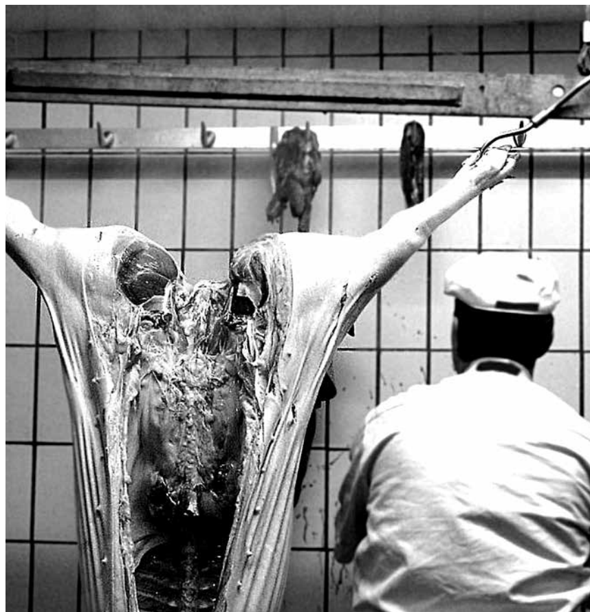
Schon handwerkliches Schlachten ist kein leichter Job...