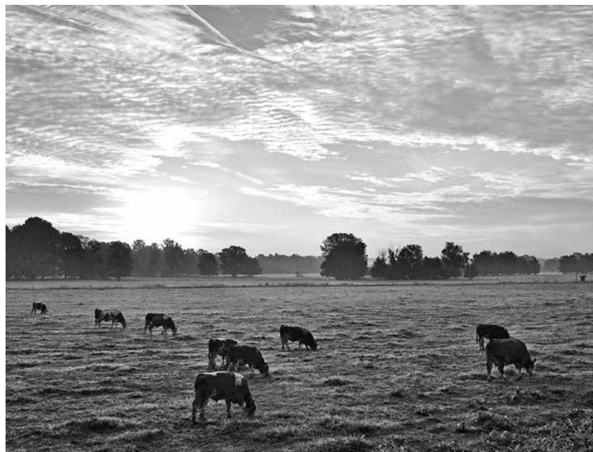
Weide, ein stimmiges System

Die Milchleistung pro Kuh war bei der Vollweide und bei Weidegang sechs bis zehn Stunden um etwa 1.000 kg Milch (FCM) niedriger als bei Weide bis sechs Stunden und bei reiner Stallhaltung. Überraschenderweise unterschied sich der Kraftfuttereinsatz bei den Betrieben nur geringfügig: Bei den Vollweidebetrieben waren es 271 g/kg Milch, bei der reinen Stallhaltung 289 g/kg Milch. Daraus kann man wohl nur den Schluss ziehen, dass Weide als Futter in den Weidebetrieben nicht wirklich ernst genommen wird. Nahezu alle anderen Untersuchungen zur Wirkung von Kraftfutterzufütterung bei Weidehaltung kommen zum Ergebnis, dass diese wenig Sinn macht. Nun ist es natürlich nicht so, dass es im nördlichen Niedersachsen keine Milchviehbetriebe gäbe, die mit Beginn der Weidesaison die Kraftfutterzuteilung deutlich reduzieren. Möglicherweise fanden solche Betriebe aber keinen Zugang zu der Studie, weil die Betriebe von der Landwirtschaftskammer ausgewählt wurden. Milchviehbetriebe mit reduziertem Kraftfuttereinsatz und Kammerberatung haben – nach eigener Erfahrung – aber wenig Kenntnis voneinander. Es muss dann schon überraschen, dass trotz des hohen Kraftfuttereinsatzes bei den Weidebetrieben und trotz ihrer geringeren Milchleistung in zwei von den