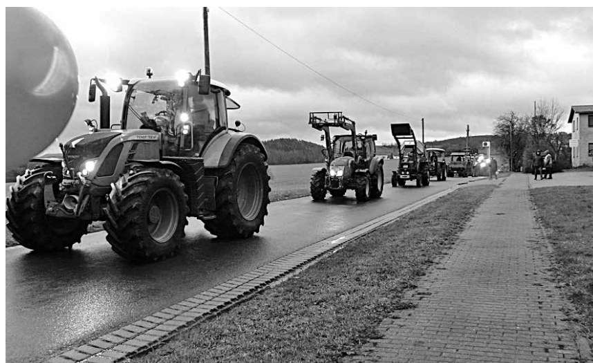
Bäuerinnen und Bauern führten mit ihren Traktoren die Menschenkette an