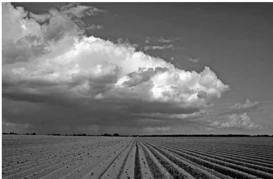
Viel Land in Bauernhand?

Momentan profitieren selten Bauern und Bäuerinnen im Bodenmarkt