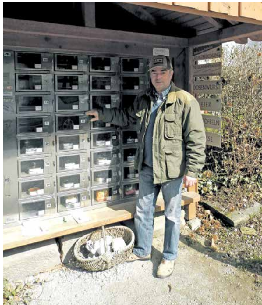
Verkaufsautomat: Innovative Vermarktungswege nicht nur beim LEH

forderte, das Punktemodell nicht einfach abzutun. Mit Blick auf den in NRW von Heinen-Esser initiierten Prozess von Umweltschutz- und Landwirtschaftsverbänden forderte er eine intensivere Auseinandersetzung mit dem Ansatz, der neben landwirtschaftlichen Kriterien eben auch gesellschaftliche Anforderungen beinhalte. „Wir setzen uns zusammen, auch mit der Landwirtschaftskammer, und sprechen das mal durch“, war das locker formulierte, aber durchaus ernst gemeinte Angebot der Ministerin, das Brändle gerne annahm. mm