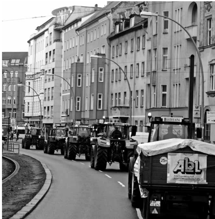
In Berlin wieder auf der Straße

Am Tag vor der „Wir haben es satt“-Demo hat der Kreis von „Wir machen Euch satt“ zu einer eigenen Aktion aufgerufen. Was sagst du Bauern und