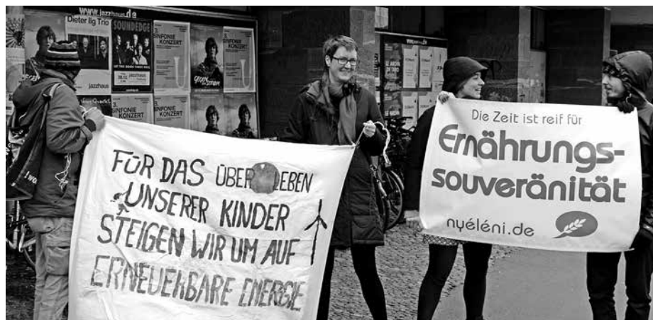
Viel Interesse für Ernährungssouveränität