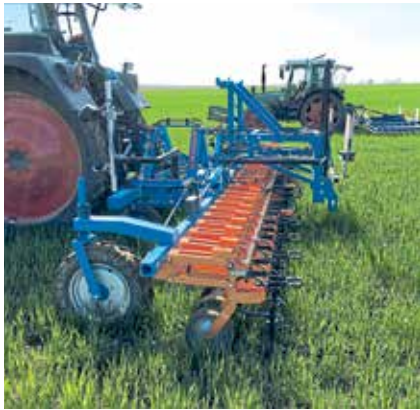
Innovativ sein – auf dem Acker, im Stall und bei der GAP