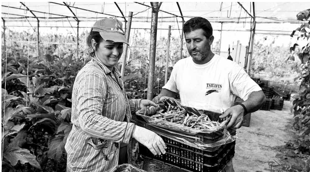
Europäische Landwirtschaft gemeinsam gestalten