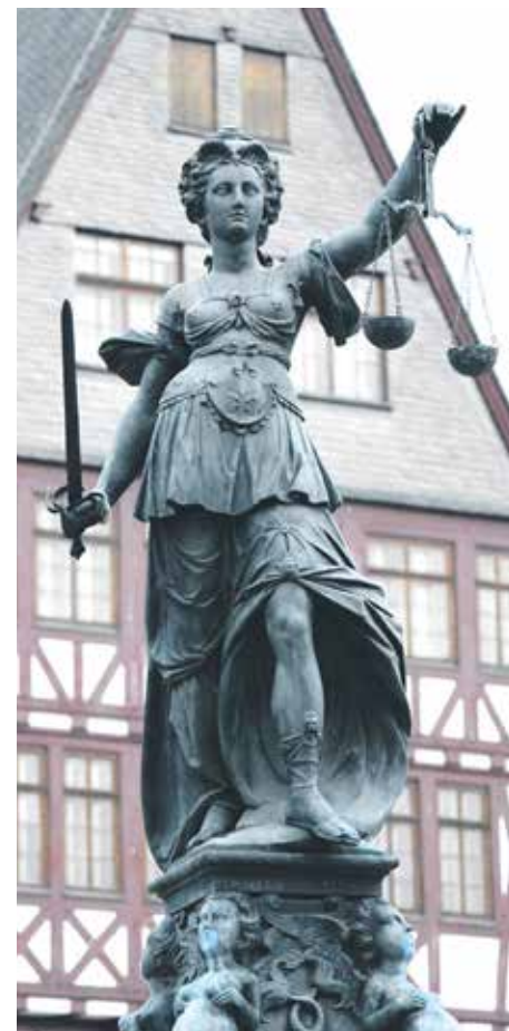
Justitia muss auch im Handel unabhängig handeln können

2009 reichte der US-Saatgutgigant Dow AgroSciences eine ISDS-Klage gegen Kanada (aufgrund des NAFTA-Abkommens) ein und verlangte zwei Millionen US-Dollar Schadenersatz. Die kanadische Provinz Quebec hatte das toxische Pestizid 2,4-D verboten, da dieses nachweislich zu erhöhten Krebsraten und Geburtsdefekten führt. Zwar urteilte das Schiedstribunal, dass Quebec keine Entschädigung zahlen müsse. Aber die Regierung musste offiziell verkünden, dass 2,4-D kein Risiko für Menschen und Umwelt darstelle, wenn die Gebrauchsanweisung korrekt befolgt werden würde. Dow AgroSciences bewertete diese Entscheidung als einen Erfolg. Das Urteil kann abschreckend auf andere Regierungen wirken, die dieses Pestizid ebenfalls verbieten wollen. So werden Initiativen, die strengere Regulierungen zum Schutz der BürgerInnen durchsetzen wollen, im Keim erstickt und die Entscheidungen demokratisch gewählter VolksvertreterInnen werden durch Konzerninteressen ausgehebelt. Oftmals enden Konzernklagen also nicht mit einer Verurteilung des Staates auf Schadenersatz, sondern die Parteien einigen sich auf einen Vergleich, bei dem nicht nur Geld fließt, sondern auch Zugeständnisse gemacht werden, die die regulatorischen Möglichkeiten des Gesetzgebers einschränken beziehungsweise Verordnungen zum Schutz der Umwelt und VerbraucherInnen verhindern oder rückgängig machen. So gibt die Datenbank der UNCTAD im September 2018 an, dass in 36,5 % der Fälle der Staat gewinnt, in 27,9 % der Fälle der Investor. So