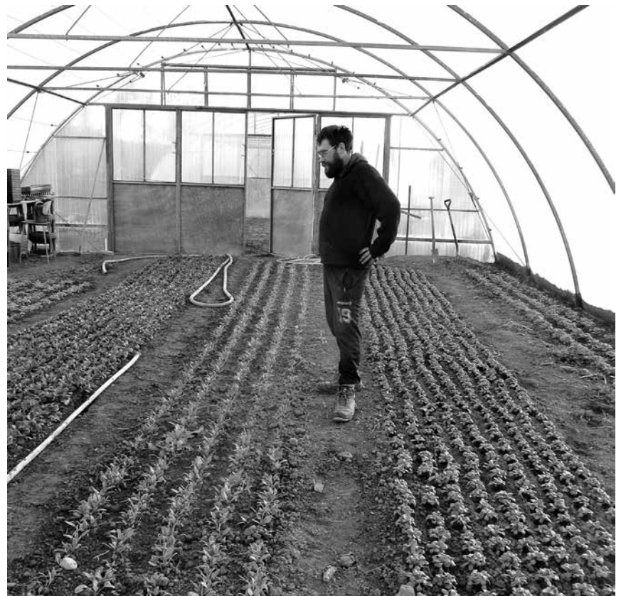
Frische Salate für den Winter

Ja, das ist ein Thema mit dem Flächenverbrauch – in ganz Deutschland und besonders in Hebenshausen. Von dem festgesetzten Ziel der Bundesregierung, den Flächenverbrauch bis 2020 auf 30 Hektar pro Tag zu reduzieren, ist an vielen Orten nichts zu spüren. Nach Angaben des Umweltbundesamtes lag der durchschnittliche tägliche Flächenverbrauch in den Jahren 2013 bis 2016 bei 62 Hektar pro Tag. Zum Großteil geht der Zuwachs von Siedlungs- und