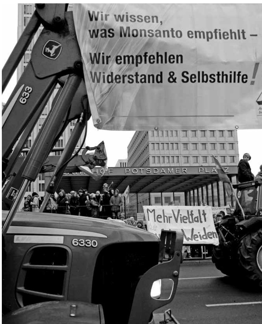
Vielfalt, Widerstand und Selbsthilfe

Große Bühne, großer Vorhang. Direkt vor dem Brandenburger Tor in Sichtweite des Reichstags, ganz nah an der Politik fand die Abschlusskundgebung dieser Demonstration zum Auftakt der Grünen Woche in Berlin statt. Und während Bundeslandwirtschaftsminister Schmidt sich mit Amtskollegen aus 40 Ländern traf, um internationale Handelspraktiken zu erörtern, wurden auf dieser Bühne erneut die Eckpunkte der notwendigen Agrarreform betont. Aber es wurde auch gefeiert, die Traktorfahrer wurden bejubelt und die Gitarrenklänge der verschiedenen Bands schafften den Rahmen für gute Stimmung zwischen Bauern, Tier- und Umweltschützern und den vielen, vielen Menschen, die gekommen waren, weil sie sich der Bedeutung der Landwirtschaft für unsere Gesellschaft bewusst sind.