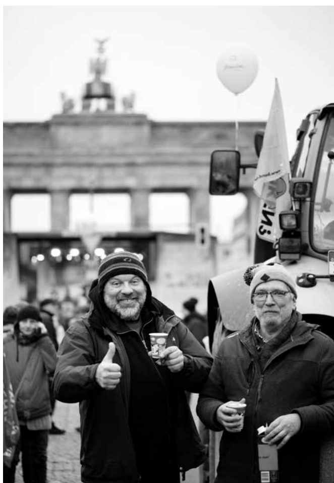
Anstoßen mit Biomilch auf gute Zusammenarbeit

Bleibt zu hoffen, dass die Verantwortlichen beim Zustandekommen eines großen Biomilcherzeugerzusammenschlusses die Chance zum Einbau von Praxisinstrumenten zur Mengensteuerung nutzen: beispielsweise interne, von Anfang an klar kommunizierte, verbindlich durchsetzbare Regeln, gegen Überlieferungen beteiligter Betriebe vorzugehen – sowie bei Vertragsabschlüssen mit Molkereien Mengensteuerungsinstrumente für Marktkrisensituationen festzulegen, z. B. im letzten Jahr ausprobierte Bonus-Malus-Modelle. cw