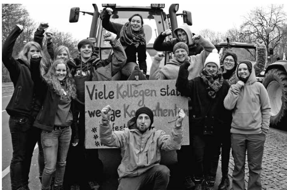
Die jungen Treckerfahrerinnen und -fahrer auf der Demo in Berlin