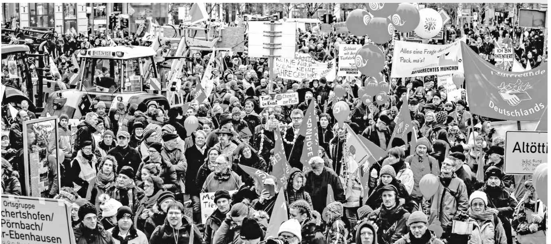
Auf gesellschaftliche Forderungen zu achten, ist auch im Ökolandbau wichtig