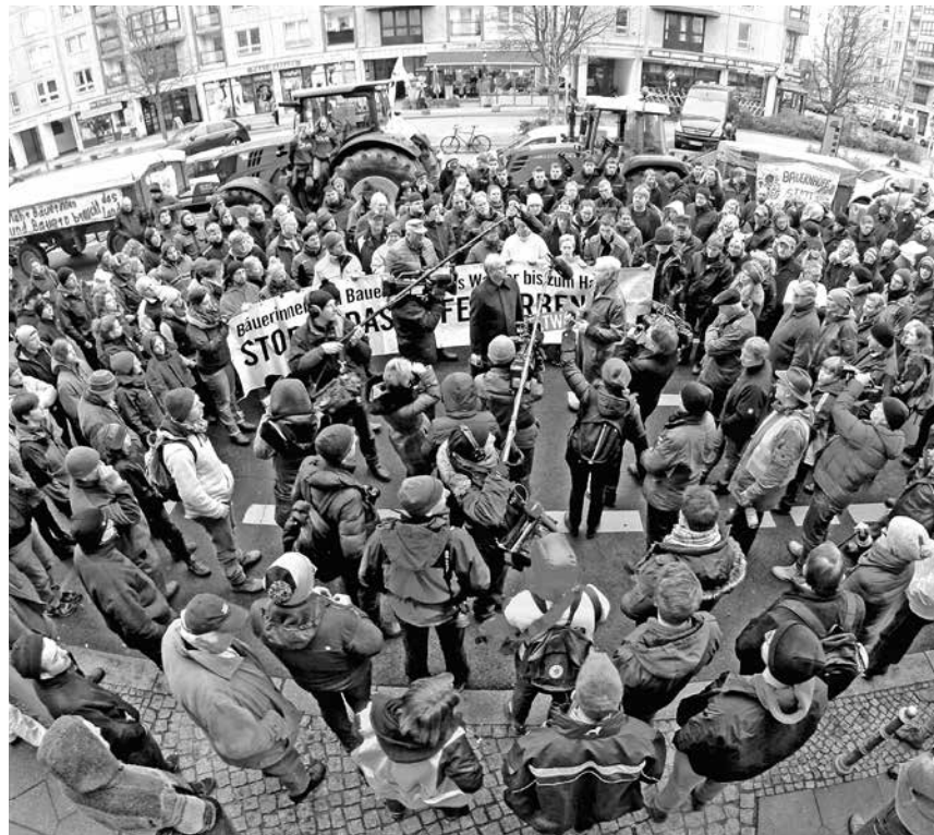
Bauern und Bäuerinnen speisen ihre Vorstellungen im BMEL ein

Am 7. 2. gibt es in Münster ein Treffen von interessierten AbLern zu Schweinehaltung, Fütterung und Vermarktung. Nähere Infos beim EFN.