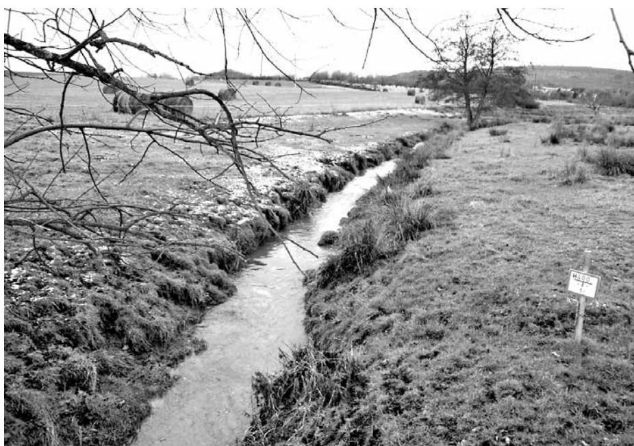
Wasserressourcen und Landwirtschaft sind nicht nur landschaftlich eng verbunden

Immer weniger Konzerne bestimmen weltweit über einen immer höheren Anteil der Lebensmittelherzeugung und Ernährung - zum Nachteil von Kleinbäuerinnen und -bauern, Landarbeiterinnen und -arbeitern sowie der regionalen Lebensmittelversorgung. Das belegt der „Konzernatlas 2017“. Mit der Zusammenstellung von Fakten und Grafiken zur Agrarindustrie, warnen die Herausgeber - Heinrich-Böll-Stiftung, Rosa-Luxemburg-Stiftung, Bund für Umwelt und Naturschutz Deutschland (BUND), Oxfam Deutschland, Germanwatch und Le Monde Diplomatique - davor, dass die laufenden Konzentrationsprozesse im Agrarsektor die 2015 beschlossenen Nachhaltigkeitsziele der Vereinten Nationen gefährden. 2015 war der Wert der Fusionen von Unternehmen in der Agrar- und Lebensmittelindustrie mit 347 Milliarden Dollar fünf Mal höher als der im Pharmasektor oder im Ölsektor. Inzwischen kontrollieren lediglich vier Großkonzerne rund 70 Prozent des Welthandels mit Agrarrohstoffen, drei Konzerne dominieren 50 Prozent des Weltmarkts für Landtechnik und in Deutschland decken vier Supermarktketten 85 Prozent des Lebensmittel Einzelhandels ab. mn