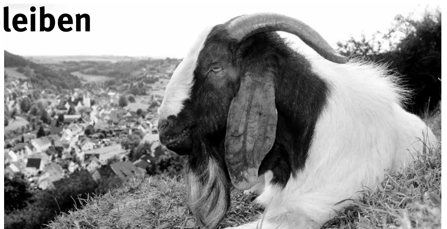
Sie müssen auch weiterhin auf der Weide entspannt wiederkäuen können

Einen scheinbar guten Ausweg bietet da Landwirtschaftsminister Schmidt. Gegenüber der Passauer Neuen Presse äußerte der Minister: „Der Wolf ist kein jagbares Wild, aber eine Regulierung des Bestandes muss möglich sein“ und gibt sich tatkräftig: „In einem dicht besiedelten Land wie bei uns müssen der Ausbreitung Grenzen gesetzt werden.“ Neben Bundesumweltministerin Barbara Hendricks, die in ihrer Reaktion auf die Möglichkeit verweist, schon heute auffällige Tiere ge-