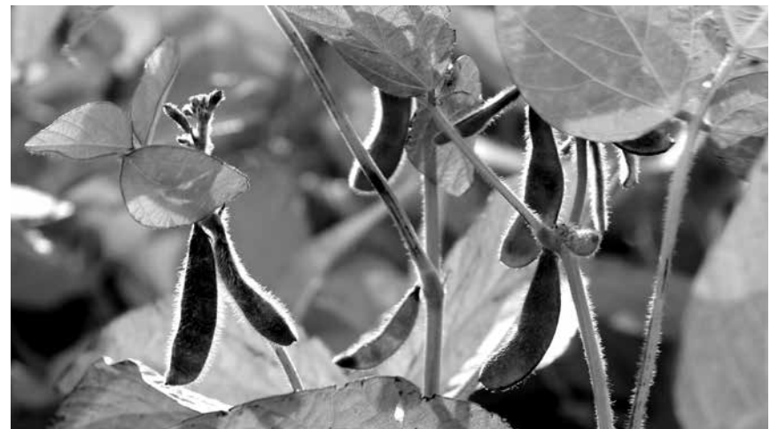
Soja: als Pflanze schön, aber in Massen zerstörerisch für Agrarstrukturen