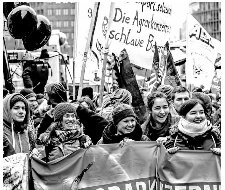
Vielen Jungbauern und -bäuerinnen fehlt der Zugang zu Land - auch wegen Geschichten wie die der KTG

Doch weil es sich bei der ATU um ein landwirtschaftliches Unternehmen handelte, genehmigte der Landkreis Prignitz den Megadeal ohne weitere Beanstandung und intensivere Prüfung. Dass es sich dabei seit Jahren um den größten Einzelverkauf nicht nur in der Prignitz, sondern in Deutschland handelte, bewog die Behörde nicht, sich beim Ministerium in Potsdam rückzuversichern und bei der Prüfung um Amtshilfe zu bitten. Auch die ATU schloss mit den veräußernden Agrarunternehmen unmittelbar langfristige Pachtverträge über 18 Jahre ab. Doch nur drei Wochen später übernahm die Münchner Rückversicherung 94,9 Prozent der ATU GmbH. Dieser Deal konnte nun von den Behörden nicht mehr geprüft werden. Denn formal wurde nicht das Land, sondern dessen Eigentümer, die ATU GmbH, verkauft. Fast jedenfalls. Denn indem die Munich Re nicht 100, sondern nur 94,9 Prozent der GmbH übernahm, vermied sie auch noch die Grunderwerbssteuer. Bei den in Brandenburg fälligen 6,5 Prozent wären das, legt man den im