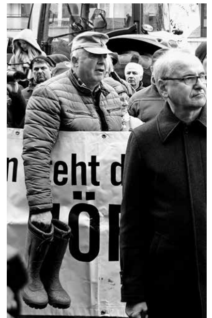
Ein Paar Gummistiefel für den Bundeslandwirtschaftsminister