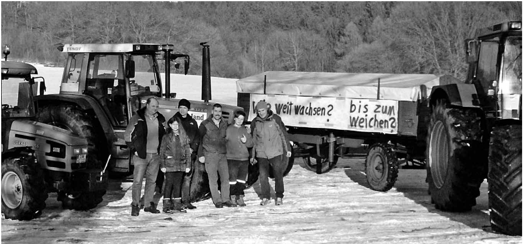
Trecker am Start!