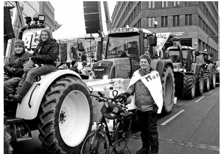
Bauern in Berlin: Mit Fahrrad und Trecker

Um Geld ging es auch in der Fragestunde mit dem EU-Agrarkommissar Phil Hogan. Acht bis zehn Milliarden Euro verliere die EU durch den Brexit insgesamt. Der Agrarbereich erhalte 38 % aus dem gemeinsamen Topf, entsprechend hoch seien die Begehrlichkeiten, machte Hogan klar. „Wir sind in der Schusslinie.“ Man müsse die Gelder noch stärker an Nachhaltigkeitszielen ausrichten. Er sei froh, dass sich die schwierige Situation auf den Märkten bessere und halte ein freiwilliges Milchmengenreduktionsprogramm auch für die Zukunft für nützlich. Befragt, ob die EU-Ökoverordnung nicht in einer Sackgasse stecke und Parlamentarier frustriere, entgegnete er, anberaumte Treffen der beteiligten Verhandlungspartner für Ende März drückten nicht eben Frust aus. Im Gegenteil, man habe nennenswerte Erfolge erzielt, es hänge im Wesentlichen an den Punkten Importe, Rückstandsgrenzwerte, Geltungsbereiche bei Saatgut und Gewächshauskulturen. Es gebe nach wie vor Kompromissbereitschaft, so dass er zuversichtlich sei, dass sich das Regelwerk unter der aktuellen maltesischen Ratspräsidentschaft abschließen lassen werde. cs