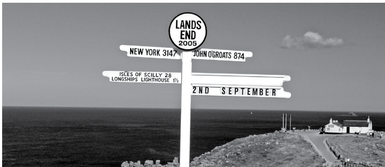
Britische Landwirtschaft am Rand des Landes und in Erwartung des Brexit