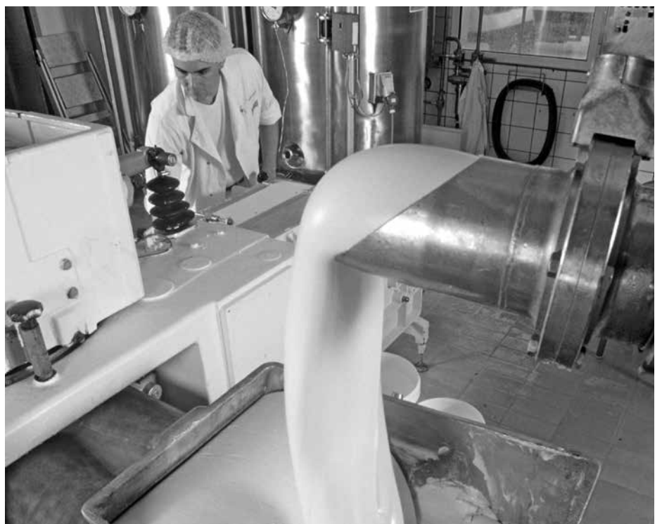
Alles in Biobutter?

Schweizer Molkereikonzern Emmi die Gläserne Molkerei Anfang des Jahres übernommen habe, da gingen dann ja auch die Preise runter. Dabei war bislang in den Milchlieferverträgen eine Orientierung am Bioland-Durchschnittspreis festgeschrieben. In dem neuen Vertrag garantiert die Molkerei, „dass der Grundpreis zuzüglich aller erreichbaren Zuschläge im Mittel eines Kalenderjahres mindestens 95 % des von der Agrarmarkt Informations-Gesellschaft mbH (AMI) veröffentlichten Durchschnittspreises für ökologisch erzeugte Kuhmilch in Deutschland erreicht“. Damit rückt an die Stelle der Orientierung am Bioland-Durchschnitt eine an einem Wert noch unterhalb des Bio-Durchschnitts. Auch das wird von den Lieferanten nicht positiv kommentiert. „Das haben sie immer weniger hingekriegt mit dem Bioland-Durchschnittspreis, deshalb wollen sie davon weg“, sagt ein Bauer. Vor dem Hintergrund, dass nicht klar ist, wie sich die Mengentwicklung mittel- und längerfristig durch vermehrte Umstellung in Deutschland und eine etwas unübersichtliche Produktions- und Exportsituation in Österreich gestaltet, mag das aus Sicht der Molkerei erstrebenswert sein. Bauern und Bäuerinnen wollen Transparenz und damit Vergleichbarkeit beziehungsweise Vertragsverhandlungen auf Augenhöhe, wie sie im Zusammenhang mit dem konventionellen Milchmarkt derzeit immer wieder eingefordert werden. Dies gilt es nun gemeinschaftlich zu organisieren. cs