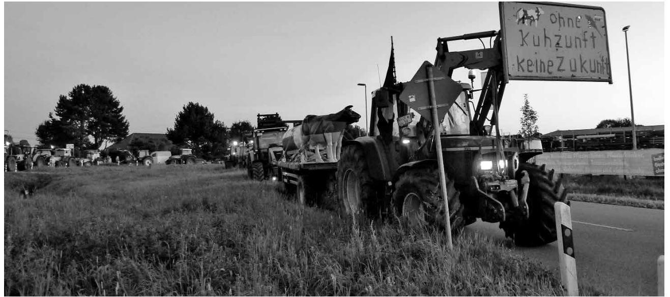
Im letzten Licht des Tages zur nächsten Aktion - Milchbauern und -bäuerinnen in Ostfriesland