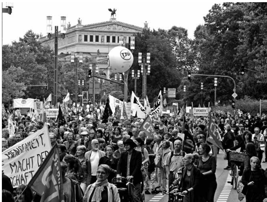
Dem Wahren, Schönen, Guten: Vor der Oper in Frankfurt