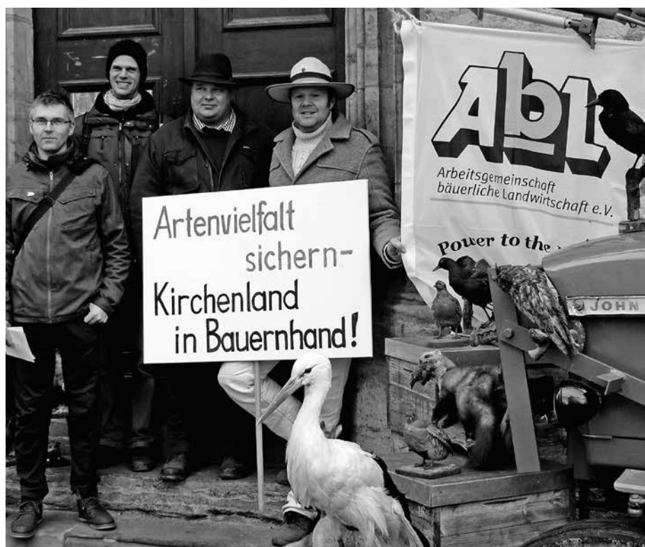
Die Kirche in die Verantwortung nehmen - hier in Erfurt zur Synode der ev. Landeskirche

Per Erlass stärkt Niedersachsen zusammen mit Schleswig-Holstein, Nordrhein-Westfalen und Mecklenburg-Vorpommern den fairen Wettbewerb in der ökologischen Legehennenhaltung. Ab April 2017 gilt für Öko-Kontrollstellen und -Legehennenhalter die Vorgabe, dass die Junghennen aus ökologischer Aufzucht und von ökologisch gehaltenen Elterntieren stammen müssen. Der niedersächsische Bestand an Öko-Legehennen besteht mittlerweile aus mehr als zwei Millionen Tieren. In der bisherigen Praxis werden per Ausnahmeklausel in vielen Fällen Junghennen eingesetzt, die von Elterntieren aus konventioneller Haltung abstammen. Dies führt derzeit zu Wettbewerbsverzerrungen mit konsequenteren Legehennenbetrieben und anderen EU-Staaten. Das niedersächsische Landwirtschaftsministerium weist auf mittlerweile aufgebaute ausreichende Bio-Elterntierbestände hin – eine Ausnahmegenehmigung habe keine Berechtigung mehr. cw