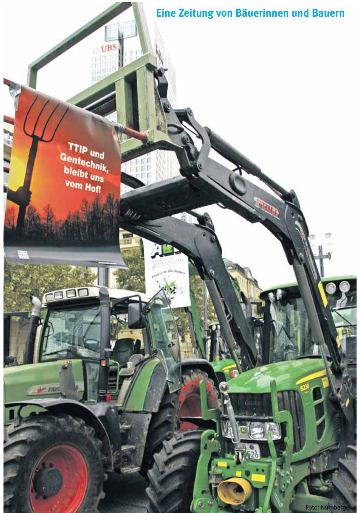
Eine Zeitung von Bäuerinnen und Bauern

Wie soll sich die Gemeinsame europäische Agrarpolitik in zukünftigen Reformprozessen verändern. Die Engländer sind raus und machen sich für ihre Landwirtschaft ganz eigene Gedanken.