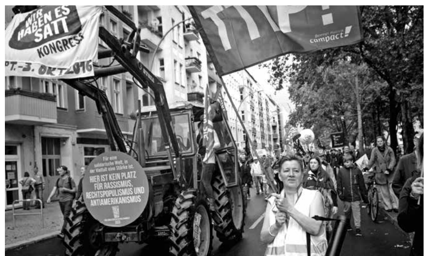
Ein klares Statement gegen Rassismus an allen Orten: Hier in Berlin