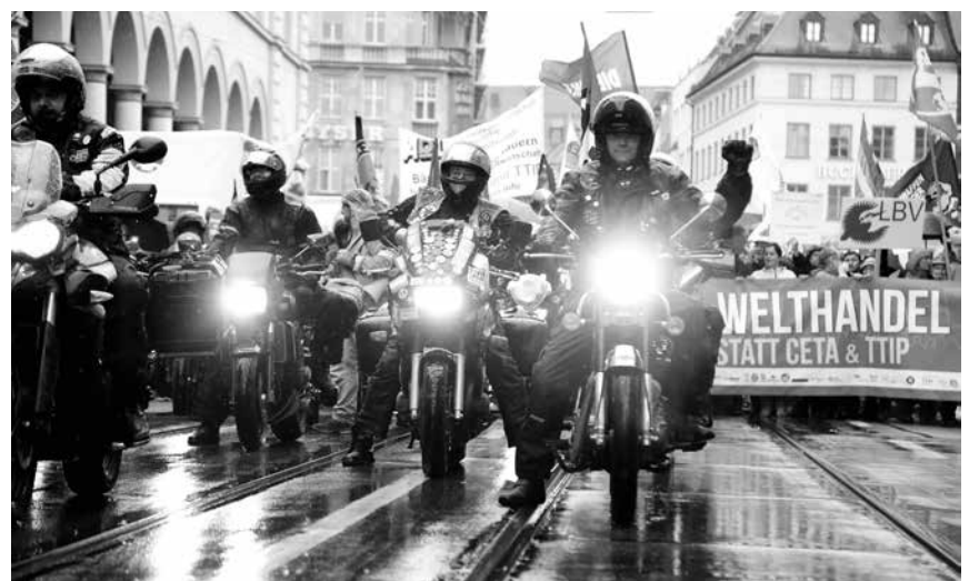
Nicht nur in München mit dabei: Die Mitglieder vom Motorradclub Kuhle Wampe