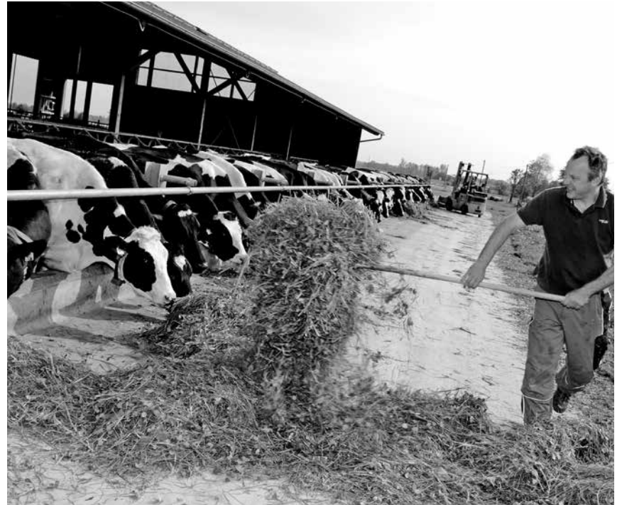
Für mehr Solidarität und Gerechtigkeit im schönsten Beruf der Welt

Jacobi sieht die Neuerungen durch den Umgestaltungsprozess des Sozialversicherungssystems differenziert: „Die Beitragsbemessung der Berufsgenossenschaft anhand des Arbeitszeitbedarfes finde ich grundsätzlich in Ordnung, aber durch die gestaffelte Ausgestaltung, wie sie jetzt ist, kommen kleinere, viehhaltende Betriebe zu schlecht weg. Da muss man nachjustieren. Es geht darum, eine Beitragsgerechtigkeit zu schaffen. Auch wird innerhalb der Fläche nicht nach Bewirtschaftungsintensität gestaffelt. Eine extensive Grünlandnutzung wird dadurch benachteiligt.“ Ulrich Jasper, Geschäftsführer der AbL, kritisiert: „Für die Beitragsstaffelung wurde eine Mengendegression eingeführt, so dass bei steigender Betriebsgröße pro Einheit weniger Arbeitszeit angesetzt und die wiederum mit dem Unfallrisiko gleichgesetzt wird. Kleinere Betriebe zahlen damit pro Tier und Fläche ein Vielfaches. Das ist eine willkürliche Festlegung. Es gibt keinen Beleg dafür, dass eine Kuh im 30-Kuh-Betrieb doppelt so viel Unfallkosten verursacht wie im 400er Betrieb oder dass eine Legehennen in