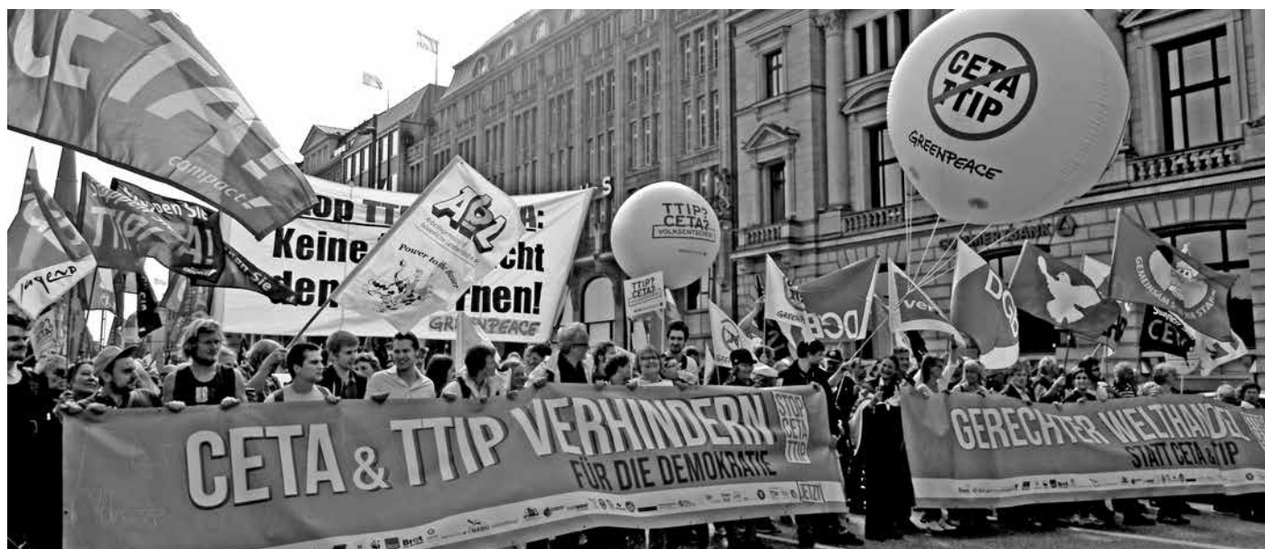
Nicht erst seit letzter Woche in Bündnissen für faire Handelsbedingungen

In Sachsen-Anhalt ermittelt die Staatsanwaltschaft in 17 landwirtschaftlichen Betrieben und gegen Mitarbeiter des Chemie-Konzerns BASF wegen Korruption. Angeblich sollen Mitarbeiter von BASF den zuständigen Personen in Agrarunternehmen für den Kauf von Saatgut und Pflanzenschutzmitteln Urlaubsreisen finanziert haben. Während die BASF-Mitarbeiter ihr „Promotions-Budget“ bemüht haben sollen, sind ihnen offenbar aber auch die Einkaufs-Manager der landwirtschaftlichen Betriebe durch zu hohe Zahlungen für die entsprechenden Einkäufe entgegen gekommen. cs