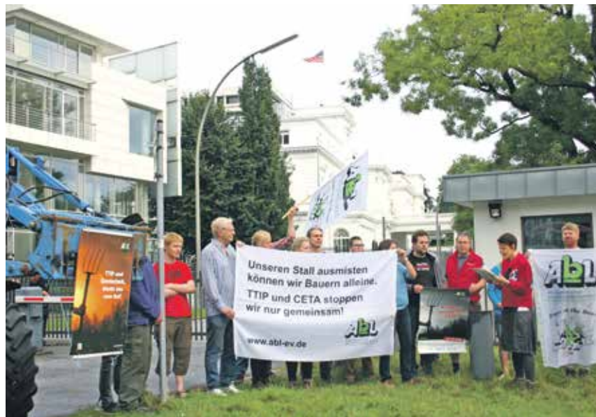
Bäuerliche Interessen vor der bescheidenen Hütte kundgegeben