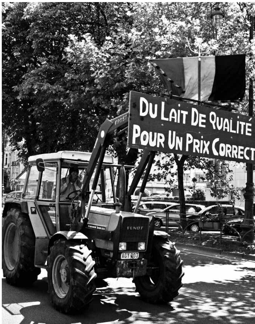
Auch wenn die Auszahlungspreise in manchen Nachbarländern höher sind, reichen sie auch dort nicht um die Kosten zu decken

Auch wenn es mit dem Milchpreis inzwischen nicht mehr bergab geht, ist die Situation auf den Betrieben nach wie vor dramatisch. Leichte Preisanstiege reichen nicht aus, um die Kosten zu decken, und schon gar nicht, um aufgelaufene Schulden abzutragen. Es wäre die Aufgabe der Politiker, die vorhandenen Steuerungsinstrumente zu nutzen, um eine langfristige und flächendeckende Sicherung bäuerlicher Milchproduktion zu gewährleisten. Die Marktteilhaber, Molkereien und Handel – das zeigen die vergangenen Monate – sind nicht bereit, angemessene Preise zu zahlen und nur unter massivem Druck dazu zu bewegen, den Auszahlungspreis anzuheben. mm