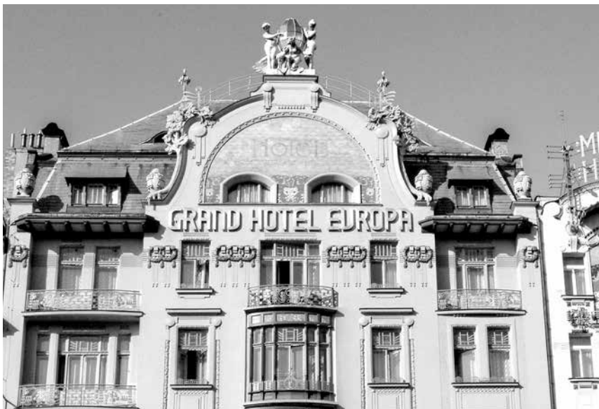
Die nächste Reform muss auch das in die Jahre gekommene ehrwürdige Haus mit neuem Leben füllen.