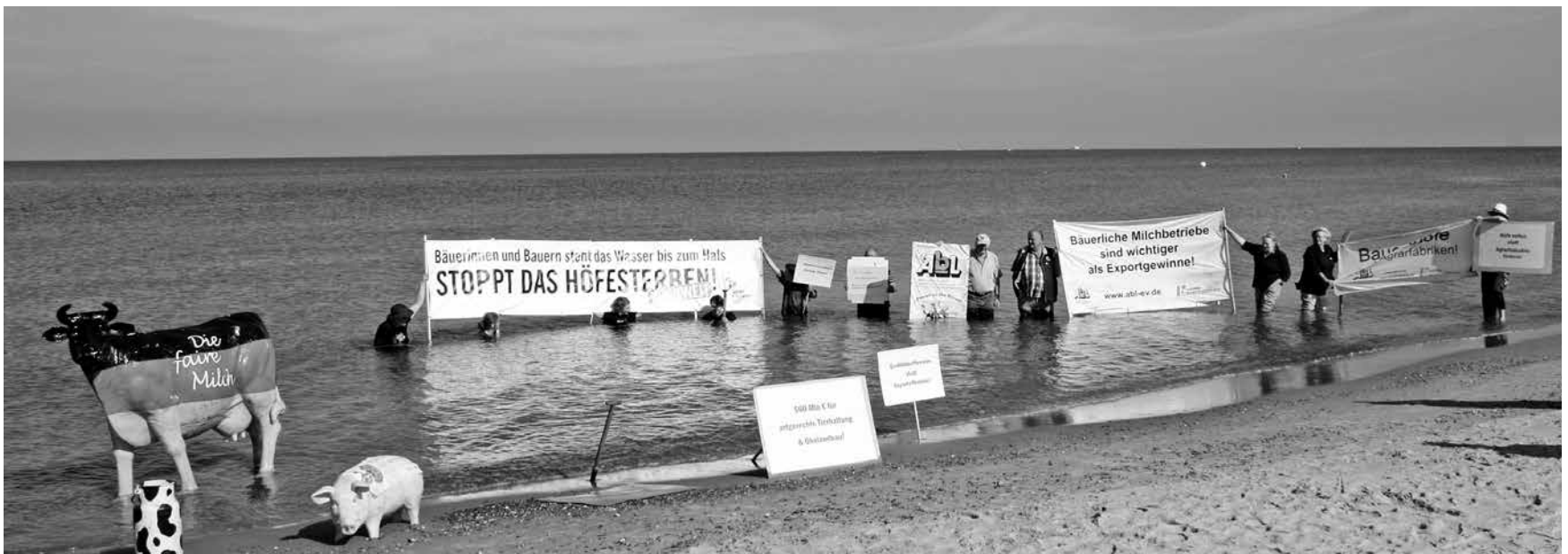
„Vielen Bäuerinnen und Bauern steht das Wasser bis zum Hals. Stoppt das Höfesterben!“, mit dieser Botschaft verdeutlichten Aktive der Kampagne „Meine Landwirtschaft“, Aktion Agrar und der Arbeitsgemeinschaft bäuerliche Landwirtschaft in der Ostsee die dramatische, existenzbedrohende Lage unzähliger Landwirte.