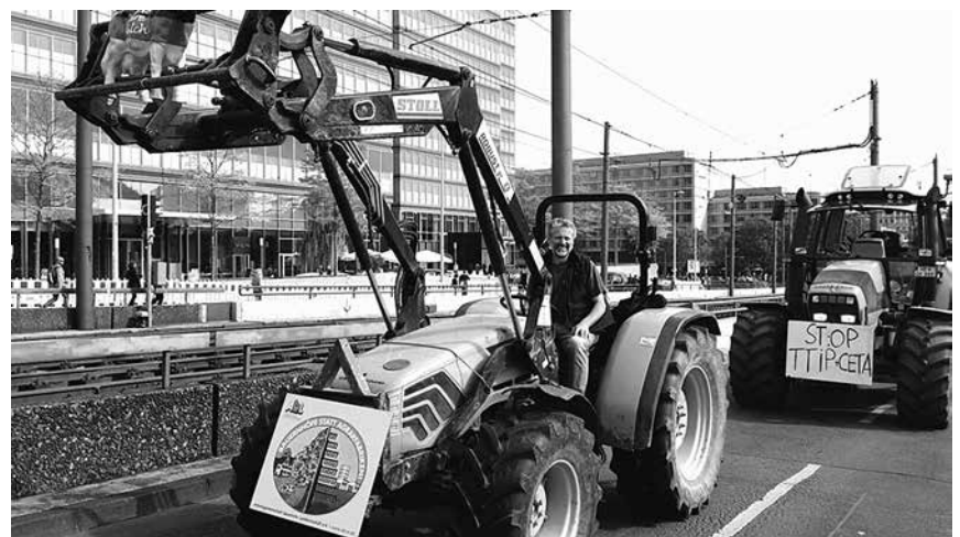
Im Cabrio kamen die Bauern zur Demo in Köln