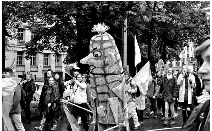
Trotz Regen waren Leipzigs Straßen voller Demonstranten

Transatlantische Bauernerklärung: abl-ev.de/themen/fairer-welthandel/positionen