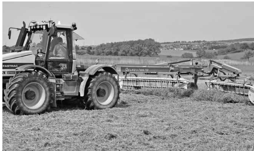
Bröckelverluste beim Schwaden vermeiden

Die Domäne Frankenhausen verfügt seit drei Jahren über eine LASCO Kombi-Flex Ballentrocknung für 20 1,60 m-Rundballen. Eine Heutrocknung produziert Qualitätsheu jedoch nicht automatisch. Über die ganze Werbungs- und Bergungskette müssen die Arbeitsgänge optimiert und die Einstellmöglichkeiten der Maschinen genutzt werden. Die Knackpunkte im Verfahren sind eine schnelle Trocknung, wenig Bröckelverluste, eine geringe Futterschmutzung sowie die Pressdichte der Ballen. Für die Heubelüftung sollte der Trockensubstanzgehalt (TS) des Ernteguts über 70 % sein, um das Heu anschließend auf 87 %TS zu trocknen. Auf dem Feld werden diese 70 %TS meist nach 48 Stunden erreicht. Wird die Mahd, wie auf der Domäne, im Schwad abgelegt, kann der Boden abtrocknen und das Erntegut anschließend breitverteilt werden. Dafür müssen Mähwerk und Wender aufeinander abgestimmt sein. Ein Walzenaufbereiter ermöglicht, die verschiedenen Bestandesbildner schonend auf-