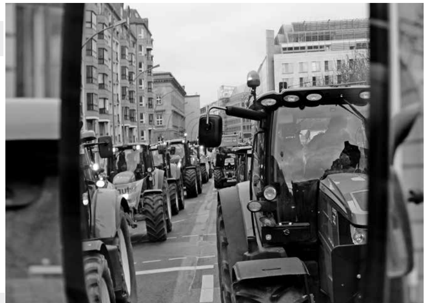
Bauern und Trecker im Spiegel

Um möglichst viele Aktive aus allen Regionen einmal jährlich zusammenzubringen, sind solche Treffen in Altenkirchen Gold wert. Es gelingt den Verantwortlichen immer wieder, hochkarätige Referenten einzuladen. So zeigt sich erneut die Notwendigkeit eines