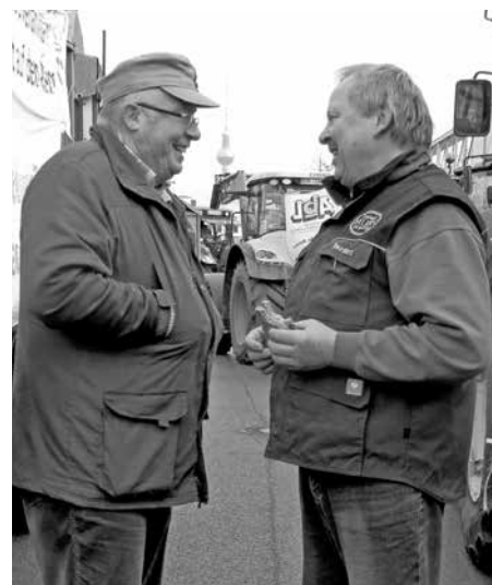
Freude über den neuesten IG Nachbauerfolg? Auf der Demo in Berlin

folgt.“ Die STV darf also Aufbereiter nicht dazu verpflichten, Sortennamen bei ihrer landwirtschaftlichen Kundschaft abzufragen. Dass die, die entsprechende Interessenvertretenden Verbände darum ringen werden, darf angenommen werden. Der deutsche Raiffeisenverband sieht keine Veranlassung, anders zu handeln, als es das Urteil vorsieht. Ein weiteres Urteil im Sinne der Aufbereiter und der Bauern und Bäuerinnen. cs