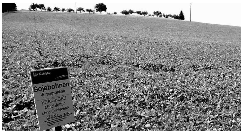
Sojaanbau im Kraichgau stolz her zeigen

Klaushof im Kraichgau, Baden-Württemberg: 40.000 Legehennen: 12.000 Freiland, 28.000 Bodenhaltung 90 ha Acker: Winterweizen, Wintergerste, Sommergerste, Mais, Soja