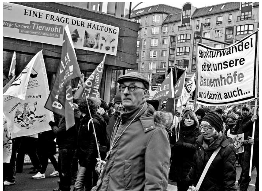
Am Bundeslandwirtschaftsministerium ein Transparent: Die Frage nach der zukünftigen Tierhaltung stellt das Ministerium eigentlich nur rhetorisch

den. Marktbeteiligte können solche Preissituationen nur bei relativ niedrigen Produktionskosten verkraften, die sind jedoch in Deutschland kaum möglich. Nun droht zusätzliches Ungemach: Deutsche Schweinehalter müssen befürchten, dass durch den bevorstehenden Abschluss des Transatlantischen Freihandelsabkommens (TTIP) der Preisdruck noch weiter zunehmen wird. In den USA machen sich Farmer berechnete Hoffnungen auf die Öffnung des europäischen Marktes für ihre wesentlich kostengünstiger erzeugten Produkte. Tier- und Umweltstandards spielen für sie nur eine sehr untergeordnete Rolle, es gibt keine Mindestlöhne für Arbeitskräfte und die Höfe haben reichlich Flächenausstattung.