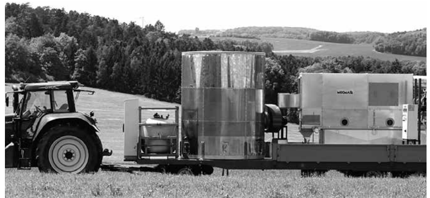
Mobile Anlage zum Sojatoasten

Donau Soja unterstützt u. a. die direkte Futternutzung von selbst angebautem Soja (oder jenem von Nachbarbetrieben) durch die Förderung von kleinen, mobilen Toastanlagen für Kooperationen vor Ort. Die Deutsche Gesellschaft für internationale Entwicklung sowie die Österreichische Entwicklungszusammenarbeit unterstützen unsere Vorhaben. Wir haben Donau Soja mit dem Ziel gegründet, insbesondere kleiner- und mittlere Betriebe zu unterstützen. Größenordnungen oberhalb von zehn Hektar scheinen aber sinnvoll für Ackerkulturen, im Bereich von einem Hektar sind geeignete Kulturen eher Gemüse oder Kräuter.