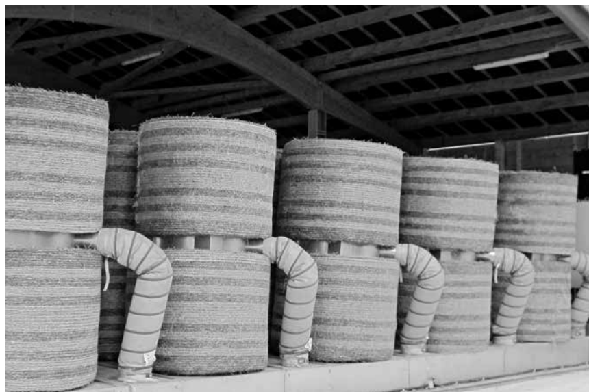
Heu in Rundballen mit Warmluft trocknen