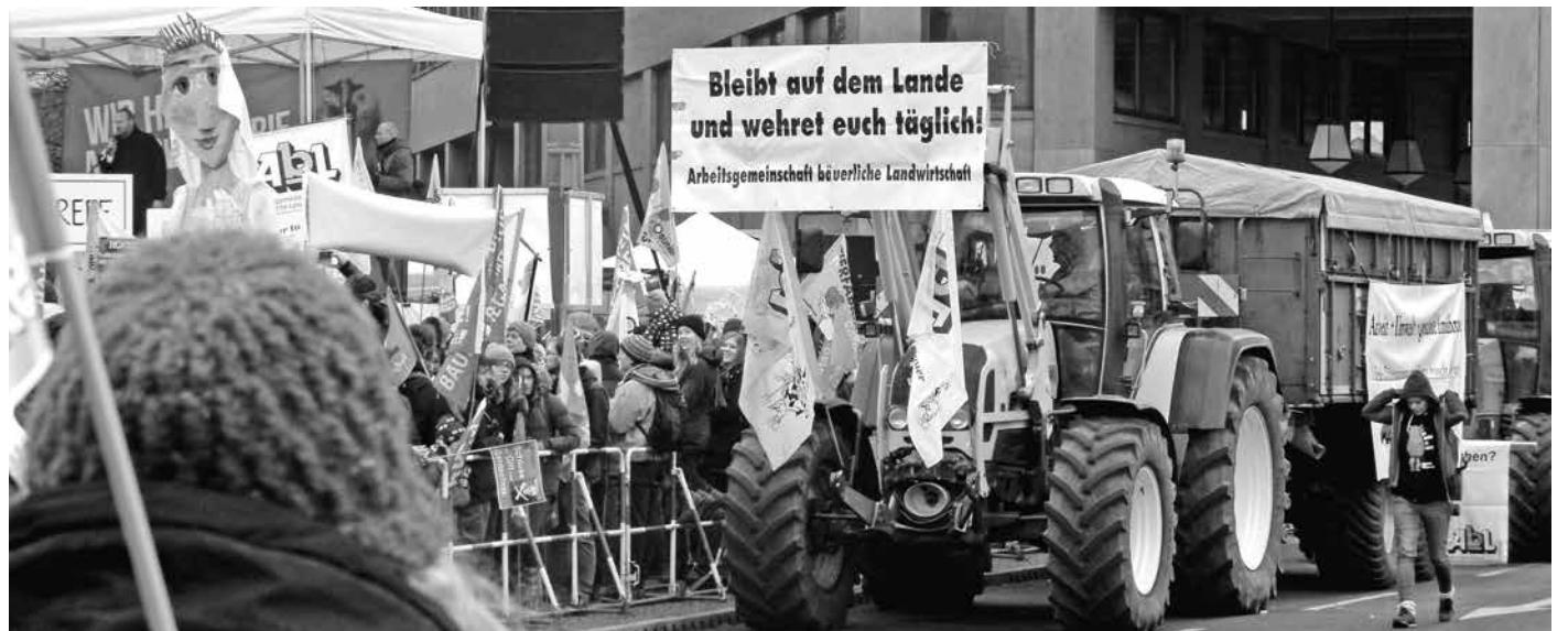
Seit 40 Jahren in der Mitte der Gesellschaft