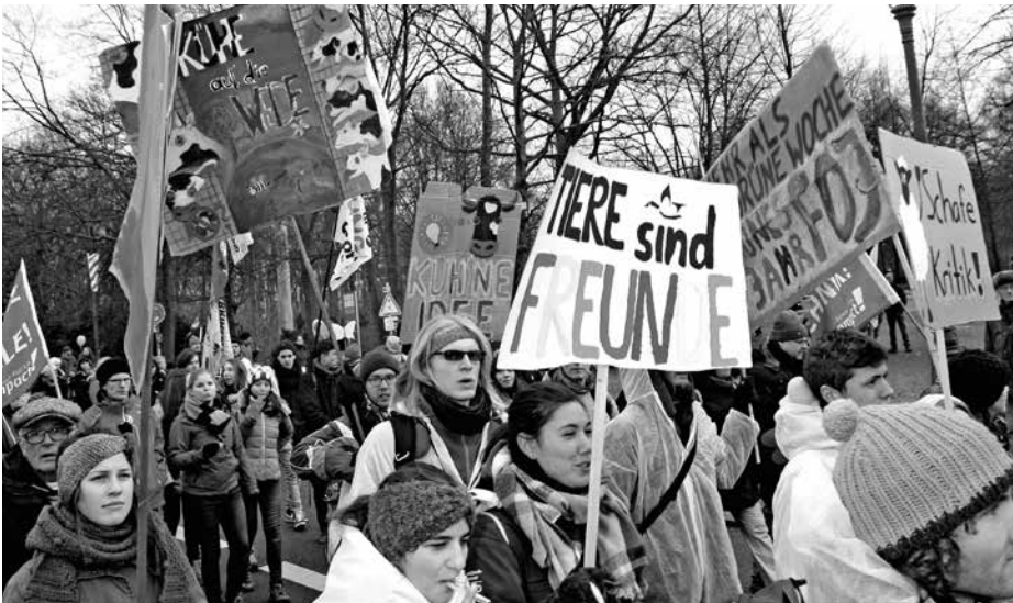
Verbraucher mit ihren Wünschen einbinden