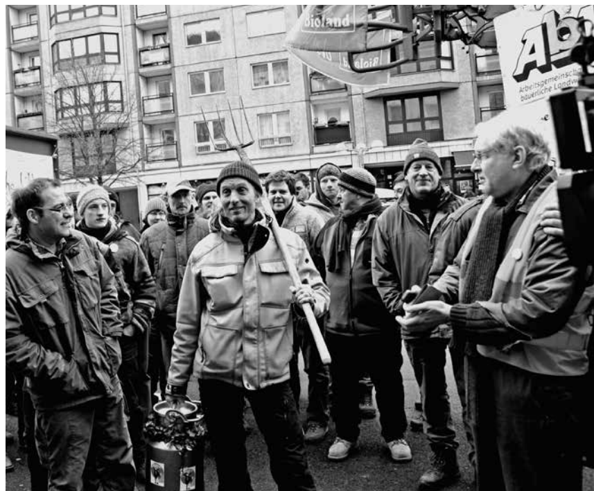
Bäuerliche Präsente für den Bundeslandwirtschaftsminister

Dass seit nunmehr sechs Jahren immer wieder Anfang Januar zehntausende trotz eisiger Kälte für bessere Lebensmittel und eine nachhaltige, umweltverträgliche Landwirtschaft auf die Straße gehen, sich für faire Handelsbeziehungen mit den Ländern des Südens und den Produzenten weltweit stark machen, ihre Ablehnung von Gentechnik, Glyphosat und industrieller Tierhaltung kundtun, sollte langsam auch die zuständigen Politiker zum Umdenken bewegen. Es ist an der Zeit, eine offene Diskussion über die notwendige Struktur einer umweltverträglichen Zukunftswirtschaft zu führen. mm