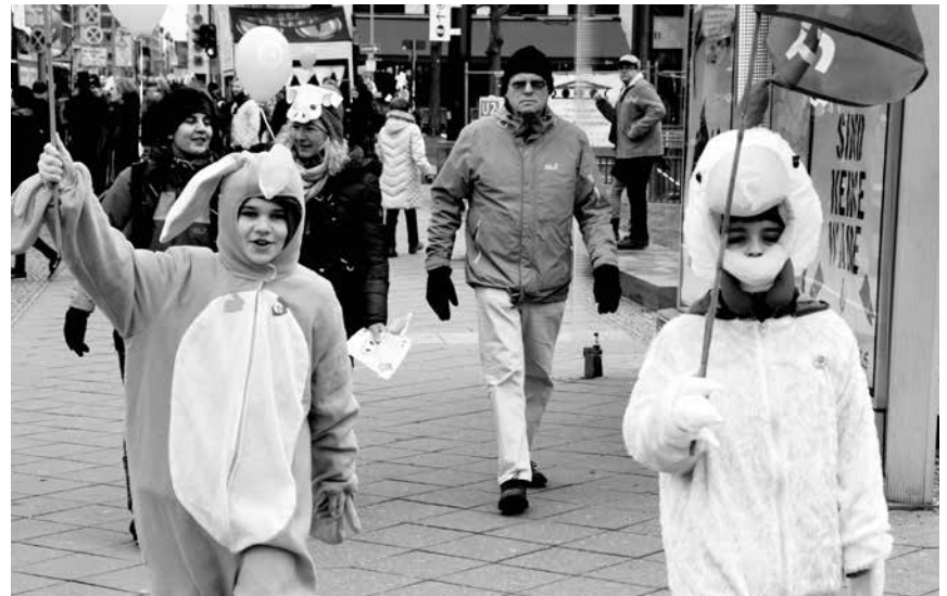
Junge Brandenburger kostümieren sich gegen Massentierhaltung.