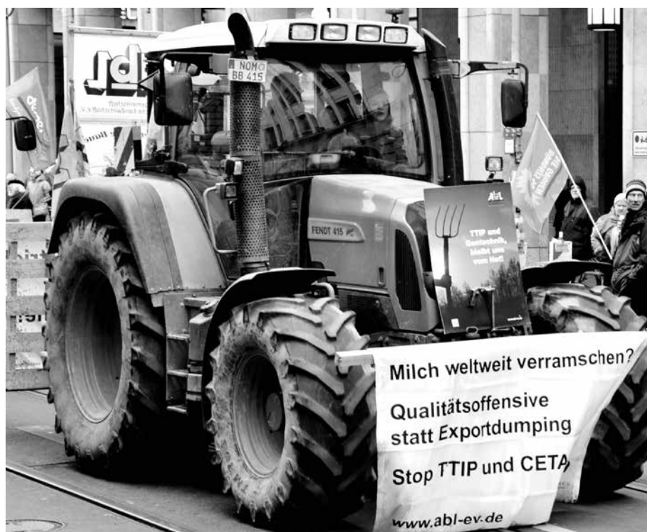
Das Freihandelsabkommen TTIP nützt Bauern weder hier noch in Amerika