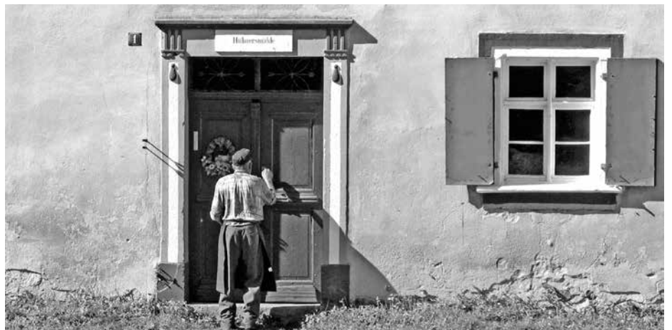
Hoftore schließen und öffnen

dass eine Aufrechterhaltung im Übrigen verfassungsrechtlich nicht mehr gerechtfertigt ist. Vom Gesetzgeber wird in verfassungsrechtlicher Hinsicht ein hinreichendes Maß an Folgerichtigkeit einfachgesetzlicher Wertungen verlangt. Durch die Neuerungen wird jedoch die Voraussetzung der Hofabgabeverpflichtung derart ausgehöhlt, dass kein durch sachliche Erwägungen geprägtes Rentensystem für Landwirte mehr vorliegt.“ Ulrich Jasper, Geschäftsführer der AbL, verdeutlicht: „Die behauptete bundesweite agrarstrukturelle Wirkung fällt weg, weil vier Fünftel der Betriebe und ein noch viel größerer Anteil der landwirtschaftlichen Flächen in Deutschland aus der Regelung ganz herausfallen. Damit erledigt sich der letzte juristische Rechtfertigungsversuch der Bundesregierung für die Ungleichbehandlung zulasten einer kleinen Gruppe von Bauern und Bäuerinnen im Rentenrecht.“ cw