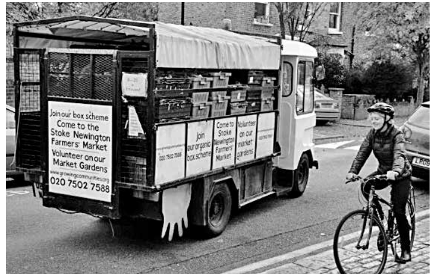
„Maisie“ rollt elektrobetrieben zu den vier Abholstellen