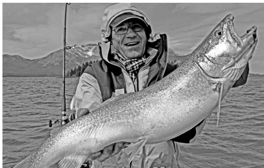
Bald noch größer, weil gentechnisch verändert