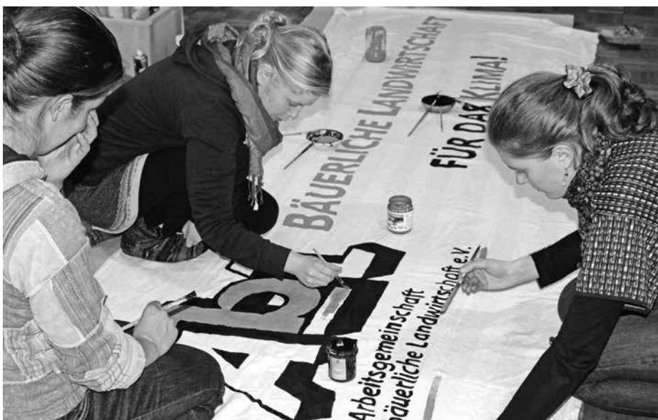
Politisches Engagement als Teil bäuerlicher Tätigkeiten

Ein Forstwissenschaftler erzählte mir von eben jenem Phänomen der Kommunikation und „Solidarität“ innerhalb einer Baumgattung und inspirierte mich zu diesem Gedicht. Buchensetzlinge haben demnach beispielsweise bessere Chancen, wenn sie neben einem älteren Baum stehen, der in trockenen Zeiten in tieferen Schichten an Wasser kommt, die der junge Baum noch nicht erreichen kann.