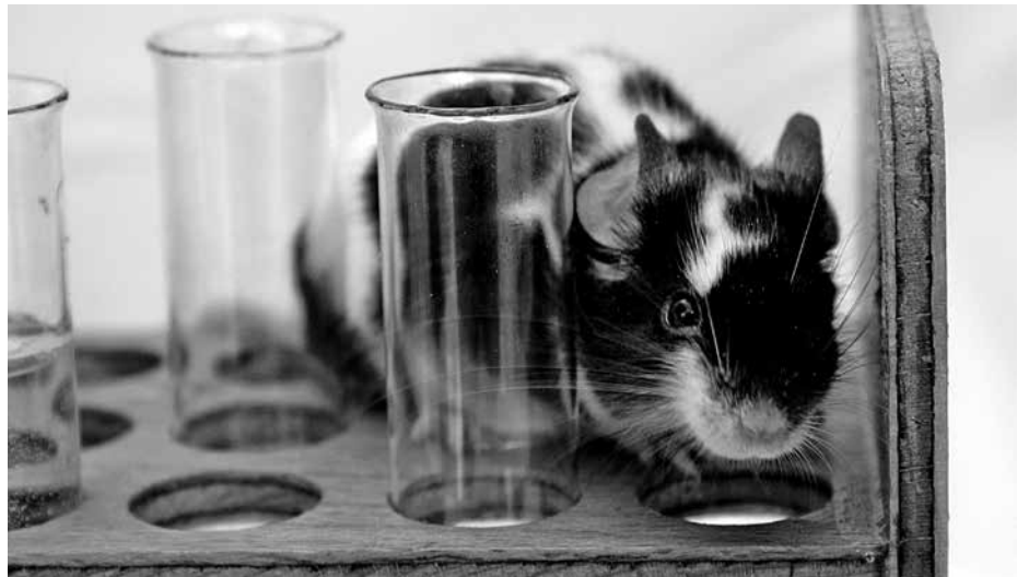
Im Dienste der Wissenschaft