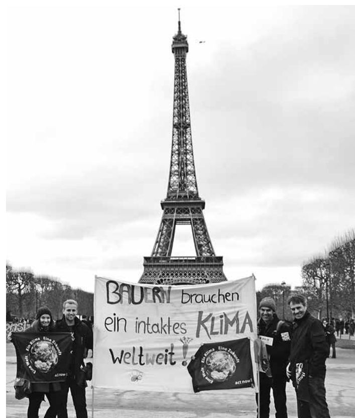
Bäuerliche Interessen in Paris hochgehalten

Die US-Chemiekonzerne Dow Chemical (Mutterkonzern von Dow AgroSciences) und DuPont wollen sich zusammenschließen, dies teilten beide Unternehmen Mitte Dezember in einer gemeinsamen Pressemeldung mit. Unter Vorbehalt der kartellrechtlichen Genehmigung soll der Zusammenschluss in der zweiten Jahreshälfte 2016 abgeschlossen werden. Firmieren soll das dann weltweit größte Chemieunternehmen unter dem Namen „DowDuPont“. Um kartellrechtliche Beschränkungen zu vermeiden, ist eine Aufspaltung in drei Unternehmen vorgesehen, die sich den Bereichen Landwirtschaft, Chemikalien und Kunststoffen widmen sollen. Eine noch nicht näher betitelt „Agriculture Company“ soll das Pflanzenschutz- und Saatgutgeschäft von Dow und DuPont vereinen. Dow Chemical erzielt im Agrarbereich rund 13 % seines Gesamtumsatzes, DuPont sogar 40 % aus dem landwirtschaftlichen Segment. av